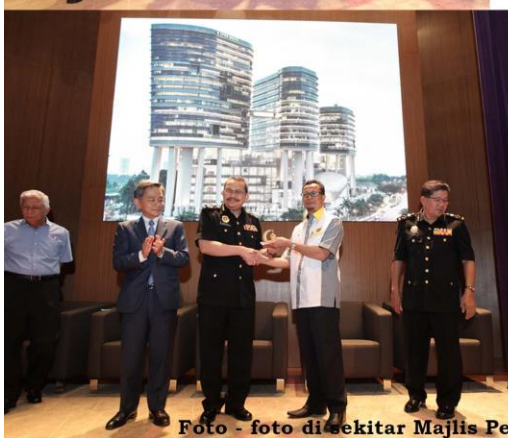
Foto - foto di sekitar Majlis Penyerahan Bangunan pada 21 Julai 2017 yang lepas.