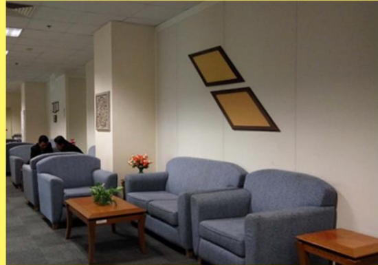
Ruang menunggu Bahagian Arkitek.