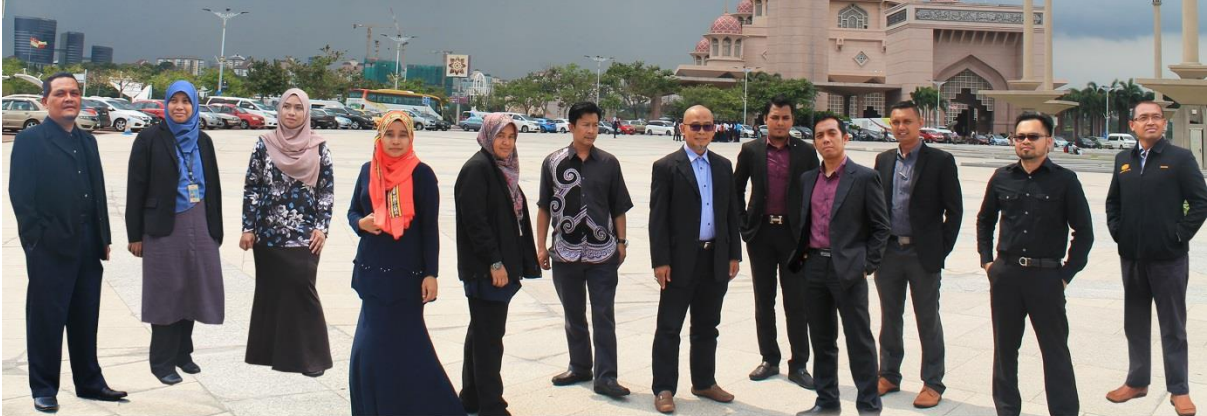
AJK Buletin bergambar di Dataran Masjid Putra, Putrajaya.