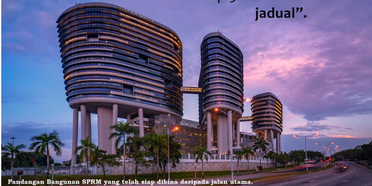
Pandangan Bangunan SPRM yang telah siap dibina daripada jalan utama.

“Projek Perjanjian Konsesi siap 5 bulan mendahului jadual”.