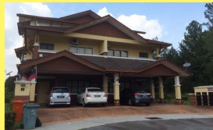
KUARTERS JENIS BERKEMBAR (1169 UNIT)