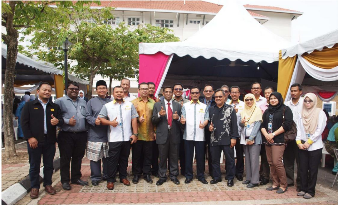
Majlis Perasmian Blok Obsterik & Neonatalogi pada 6 Julai 2017