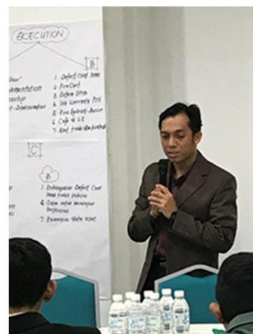
Aktiviti - aktiviti yang dijalankan semasa bengkel.