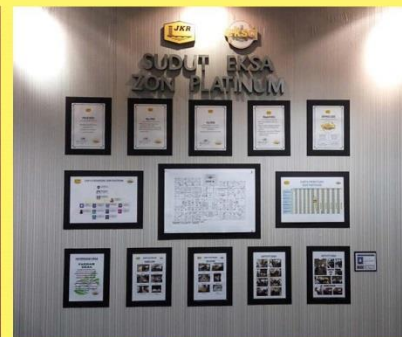
Sudut EKSA zon plantinum.