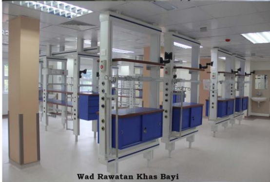
Wad Rawatan Khas Bayi