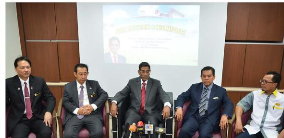
Sidang media Majlis Perasmian Blok Obstetrik & Neonatologi, Hospital Putrajaya.

“Projek contoh hospital 61 katil dengan kos RM 16 juta ” - YB Menteri Kesihatan