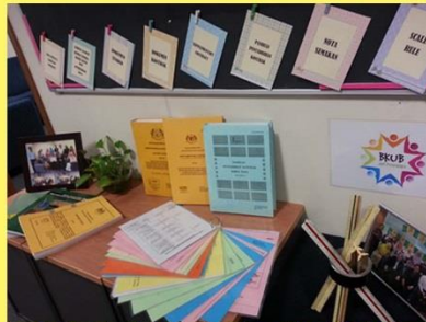
Sudut bahan Bahagian Ukur Bahan