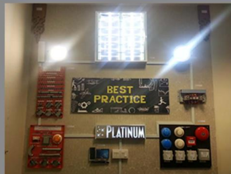
Sudut bahan Bahagian Elektrik.