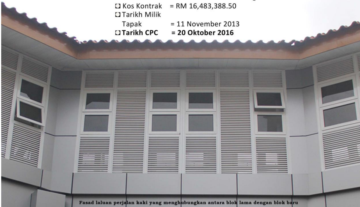
Fasad laluan perjalan kaki yang menghubungkan antara blok lama dengan blok baru