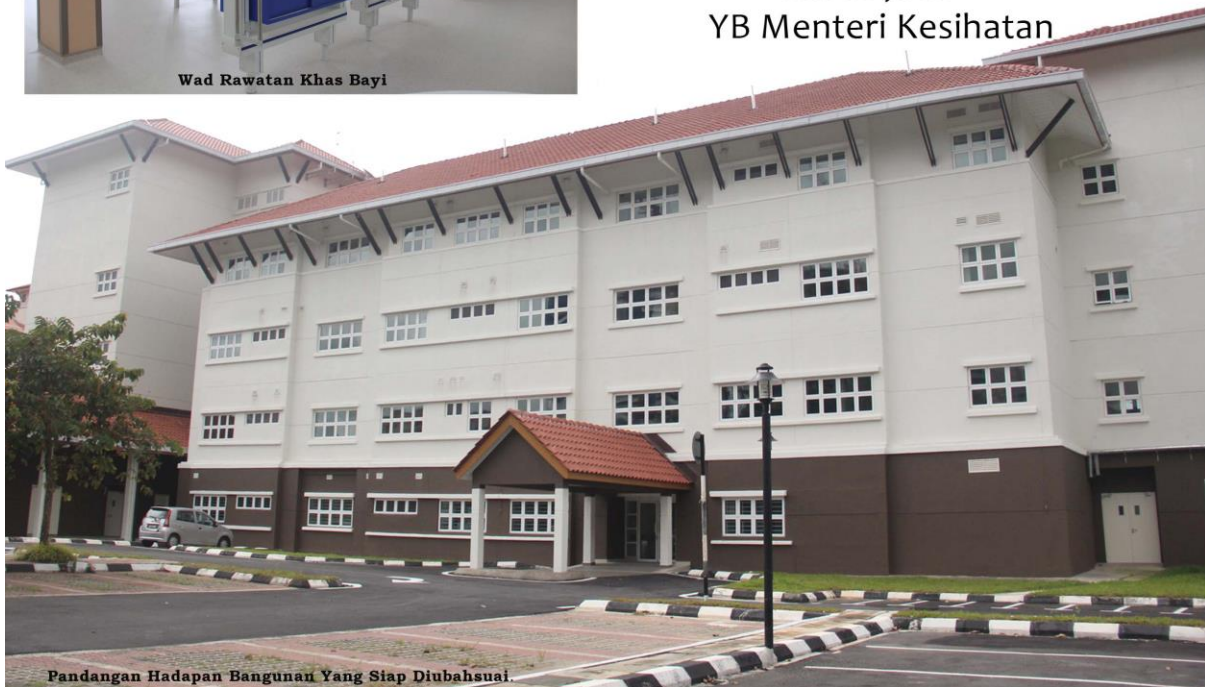
Pandangan Hadapan Bangunan Yang Siap Diubahsuai

“Projek contoh hospital 61 katil dengan kos RM 16 juta ” - YB Menteri Kesihatan