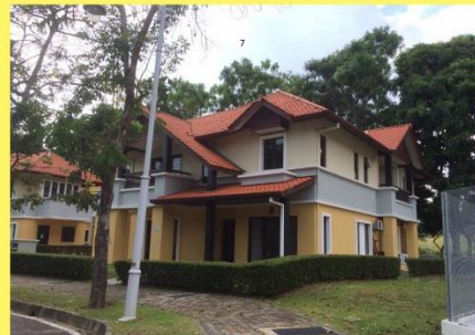
KUARTERS JENIS BANGLO (98 UNIT)