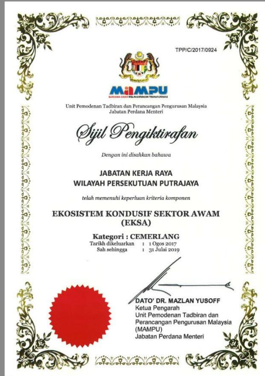
Sijil Pengiktirafan oleh MAMPU.