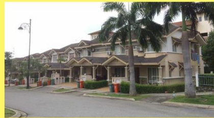
KUARTERS JENIS TERES (3396 UNIT)