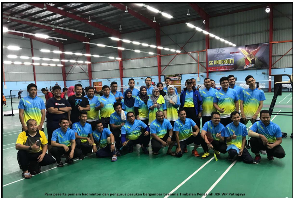
Para peserta pemain badminton dan pengurus pasukan bergambar bersama Timbalan Pengarah JKR WP Putrajaya