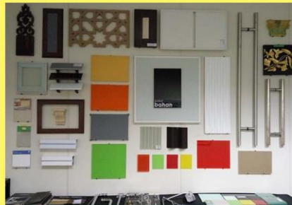
Sudut bahan Bahagian Arkitek.