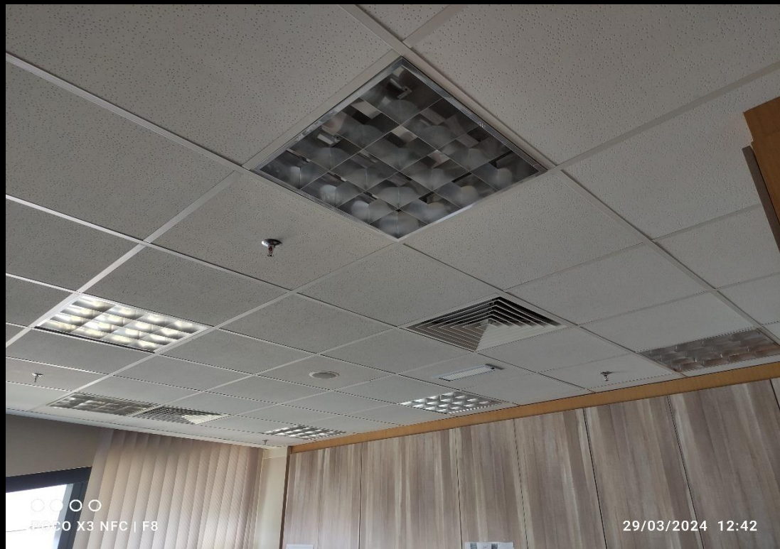
Ruang pejabat serta bilik-bilik pejabat