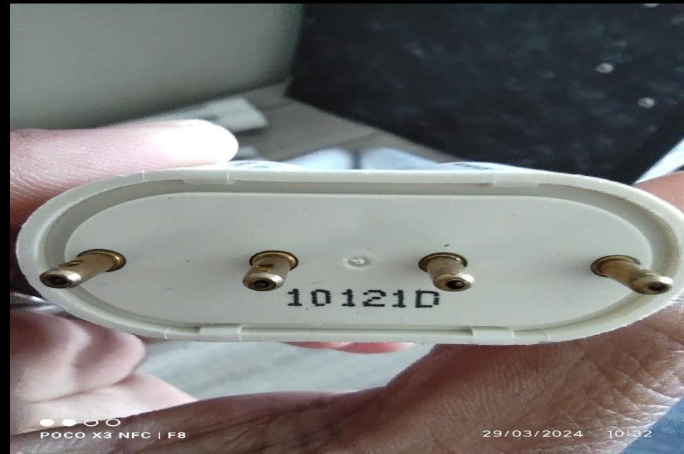
Jenis 4 PinTiub Lampu PL-L sedia ada di tapak