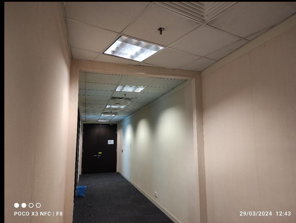
Ruang koridor pejabat