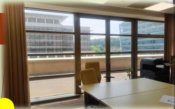
Contoh gambar: Aras 6,core 1 (Dalam pejabat)