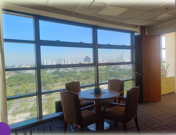
Contoh gambar: Aras 7,core 3 (Dalam pejabat)