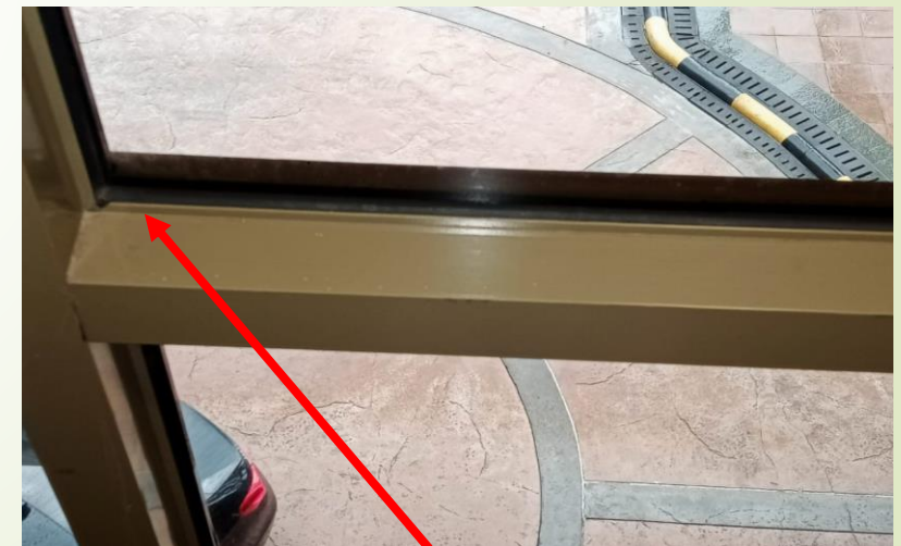
Contoh gambar sealant (hitam) di lokasi