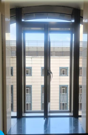
Contoh gambar: Aras 6,core 3 (Dalam Tandas Lelaki & Wanita)